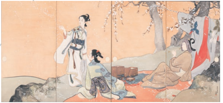
鯨崎英朋《春秋観花園屏風》1904年(明治37)