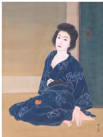
千種掃雲《ほづきの女》1911年(明治44)

その内容は、一部に他館所蔵品を交えて、明治から昭和初期にかけての女性を描いた作品を「四季風物と美人画」「女の暮らしと人生」「女の装い プラス・マイナス」「少女と美人画」という構成で展覧し、一般にイメージされる美人画から、その周辺にあって美人画そのものを照射し、その領域を拡大させる女性像など、近代において変容をとげる美人画の諸相を画家達による「ラプソディ(狂想曲)」と捉え紹介するものです。個性的な画家たちが絵に留めようとした多様な女性美、あるいは女性たちの生のありようから、近代における「美人画」の意義や、絵画表現に与えたインパクトを検証する絶好の機会となるものです。