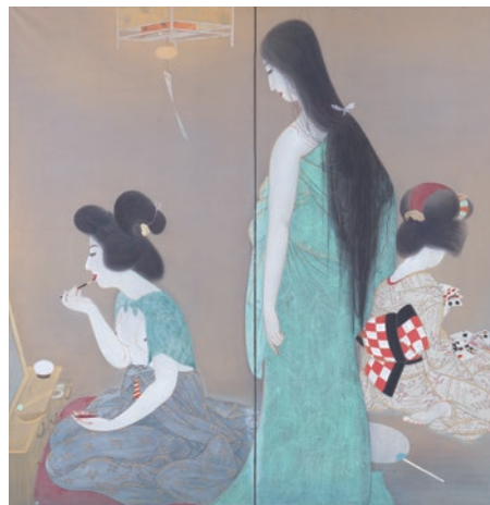
増原宗一《夏の宵》1926年(大正15)