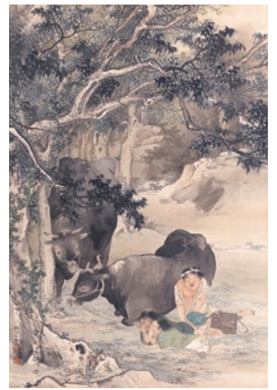
竹内栖鳳《涼蔭放牧》1897年(明治30)

栖鳳画塾・竹杖会は、土田麦僊(1887~1936)をはじめとする個性豊かかつ実力ある画家を輩出しました。栖鳳は、弟子たちの自主性を重んじ、活動を見守った指導者でした。麦僊も同じく、自身の画塾・山南塾で、「仙人画家」とも称された小松均(1902~1989)という個性的な画家を育てました。栖鳳、麦僊そして小松均、それぞれの世代で鋭く己の芸術を見据えながら、次世代を尊重して育ててきた京都画壇の系譜をご覧ください。