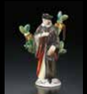
《双ロセント・ボトル》 イギリス チェルシー 1755年頃

海の見える杜美術館が長年にわたり収集および調査をしてまいりました、香水瓶コレクションより厳選した香水瓶を、いつでもご覧いただけます。