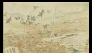
竹内栖鳳《棲鳳十二富士》1893年(明治26)頃

生涯を通じ、栖鳳にとって旅は新たな風物に触れる貴重な経験であり続けました。本展では、修行時代、師の幸野椋嶺に随行して旅した北越の風景を描く《北越探勝帖》や、名所である富士を自ら取材しさまざまな描いた《棲鳳十二富士》のほか、豊富なスケッチ等の資料で、栖鳳の目を通して見た景色をご覧いただけます。